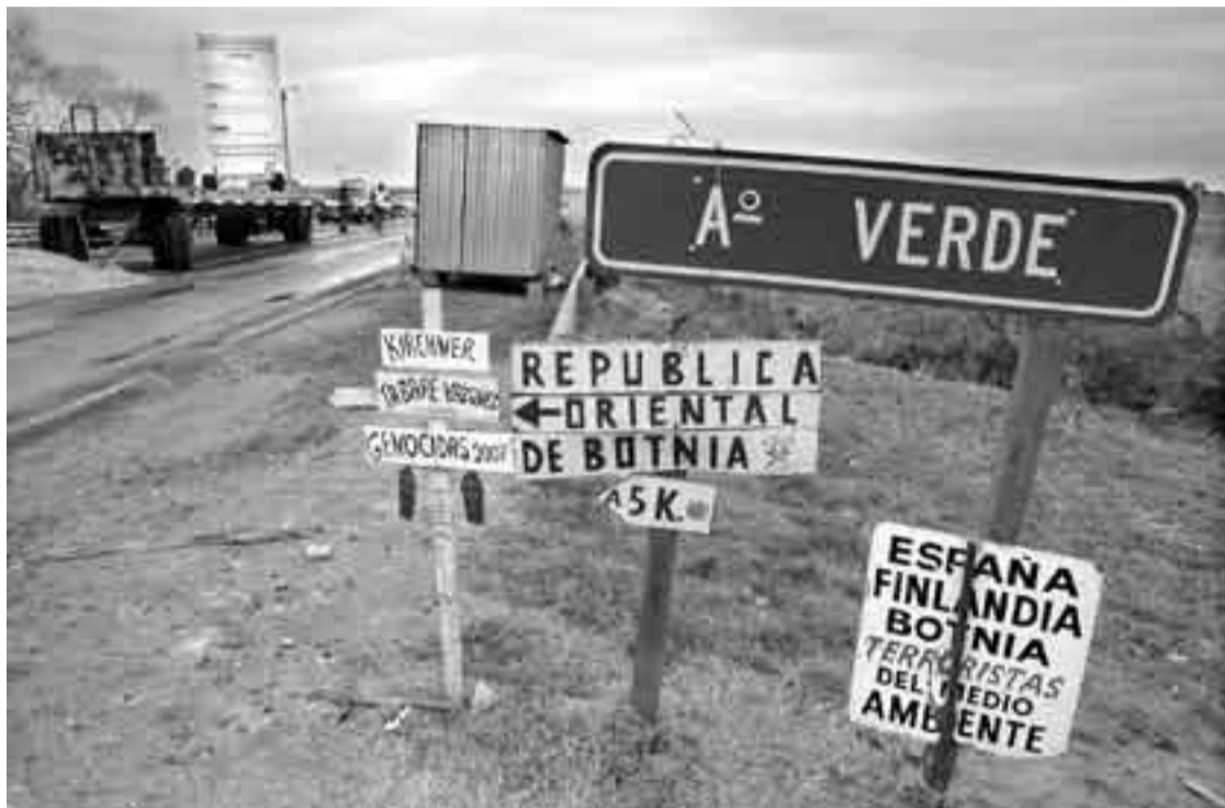
Corte de la ruta nacional argentina que une Gualeguaychú con el puente internacional que la une a Fray Bentos.

▼ ACTAS DE LA CARU REVELAN QUE URUGUAY INFORMÓ A ARGENTINA SOBRE BOTNIA ANTES DE OTORGAR AUTORIZACIÓN