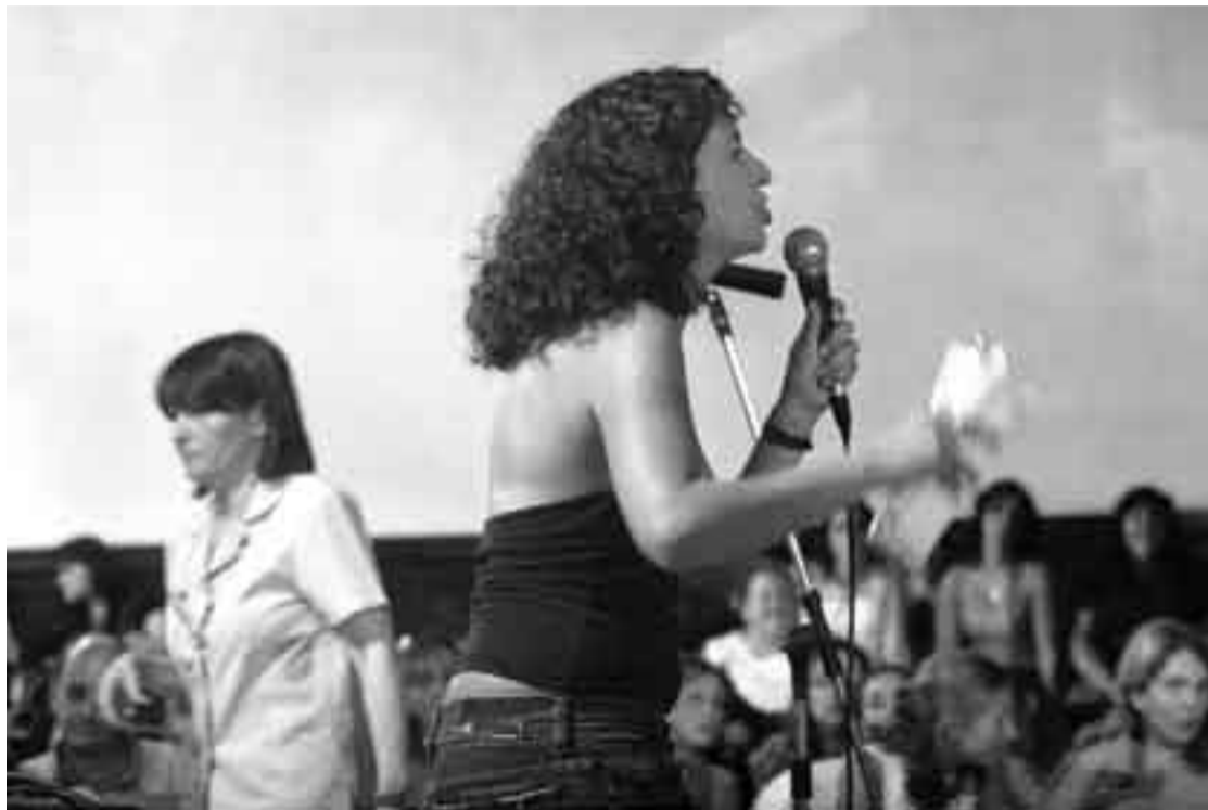
Asamblea de Ademu, ayer en el Palacio Sudamérica.

Las nuevas mochilas y útiles escolares que los niños de Montevideo esperaban estrenar en este inicio del año lectivo deberán esperar por lo menos unos días más dentro de los armarios. Es que los maestros reunidos ayer en asamblea en el Palacio Sudamérica decidie-