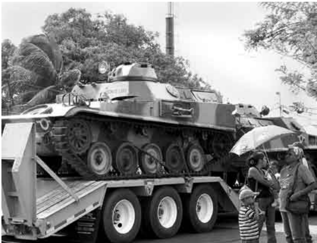
Un convoy militar transporta tanques de guerra venezolanos por las carreteras del estado Zulia, Venezuela, fronterizo con Colombia.

El hallazgo del cuerpo de un guerrillero ayer en Ecuador, con varios