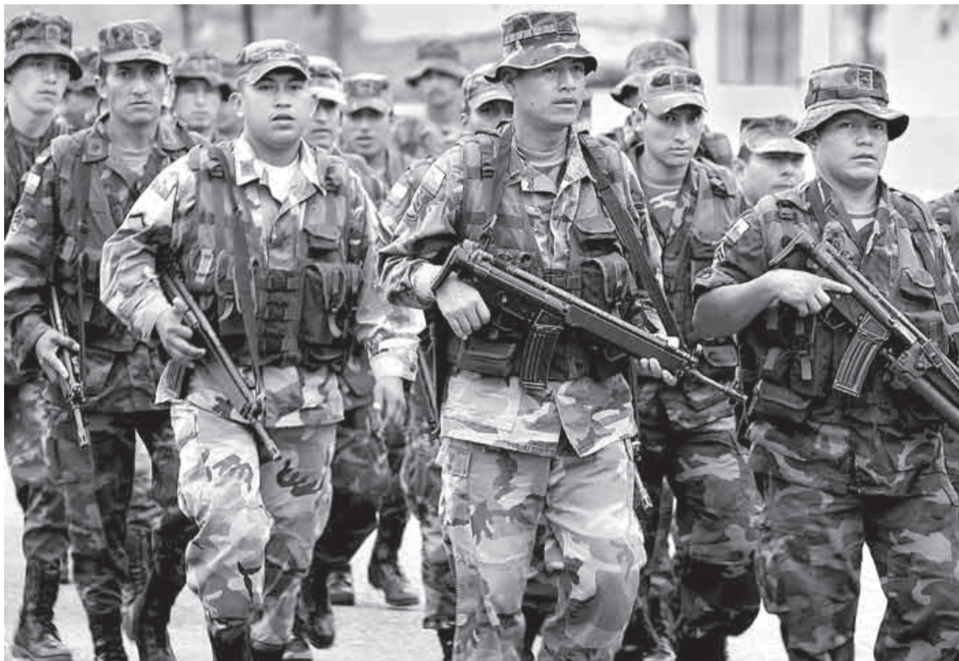
Militares ecuatorianos se movilizan hacia la frontera norte con Colombia para reforzar la seguridad en la zona después de la operación militar colombiana en territorio ecuatoriano en la que murió "Raúl Reyes", número dos de las FARC.