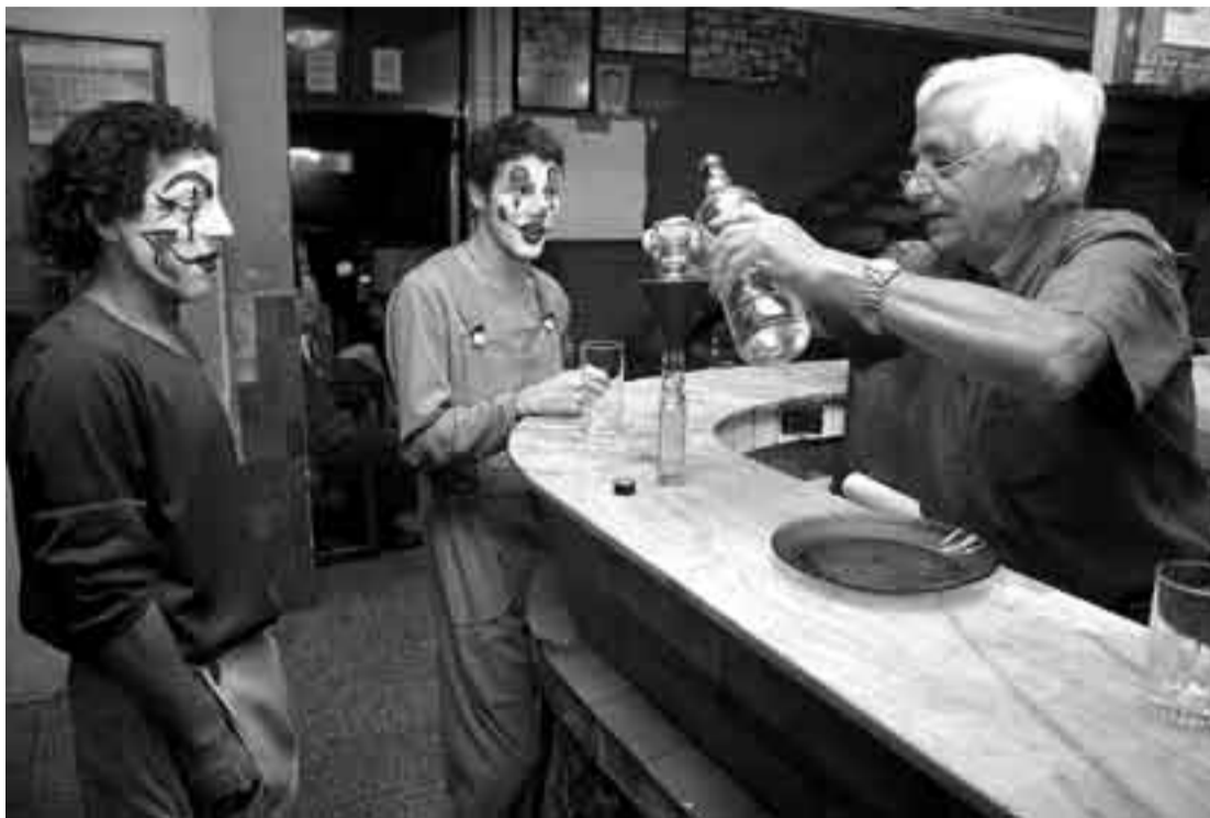
Integrantes de La Gran Siete en la cantina del club de bochas Nueva Palmira.

El movimiento que genera el Carnaval es cada vez más grande. Cada vez hay más gente pidiendo