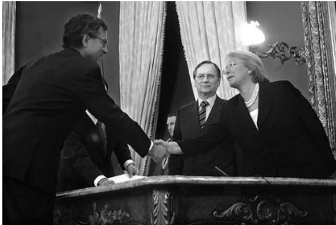
La presidenta chilena, Michelle Bachelet, toma juramento al ministro de Transportes, René Cortázar, en el Palacio de La Moneda en Santiago.

Diseñado bajo la presidencia de Ricardo Lagos, el plan Transantiago fue puesto en marcha en febrero pasado. Su aplicación ha generado