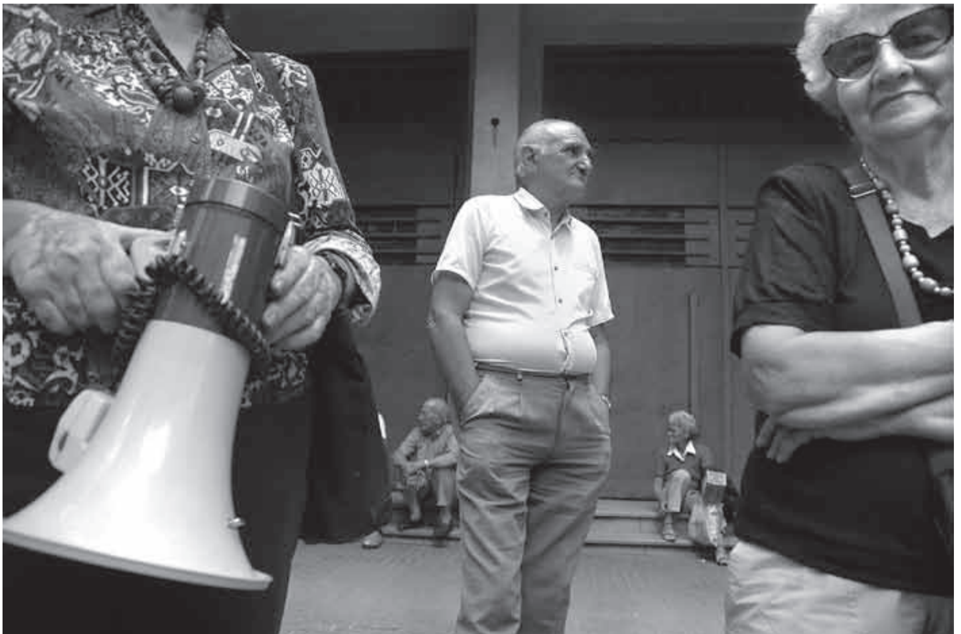
Explanada del BPS, ayer, cuando se concentraban los manifestantes convocados por la Organización Nacional de Jubilados y Pensionistas del Uruguay (ONAJPU).