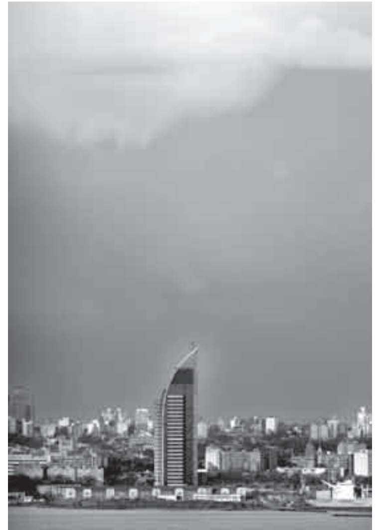
La torre de ANTEL, vista desde el Cerro.

guró a la diaria que a lo largo de la gestión pasada "se sumaron cargos y se repitieron los que estaban, mediante la designación directa sin que hubiera llamados abiertos".