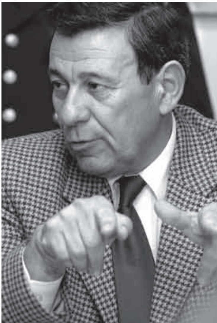
Rodolfo Nin Novoa. / FOTO: SANDRO PEREYRA (archivo, mayo de 2006)

Por su parte, el ministro del Interior, Aníbal Fernández, afirmó que “la discusión es con Botnia” y con el Banco Mundial, y que “Argentina y Uruguay somos la misma cosa”, aun-